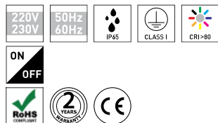
LEMUR 9W TABELA DE PRODUTO E ESPECIFICAÇÕES TÉCNICAS - CRI→80